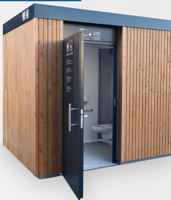
HEXABOX habillage bois naturel