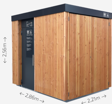
Habillage bois naturel vertical