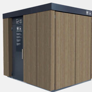
Habillage bois composite vertical