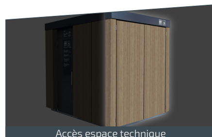
Accès espace technique